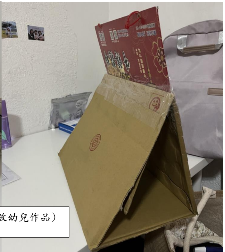
團討版 (下面三角形可以放幼兒作品)