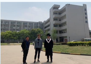
師資生與臺校合照