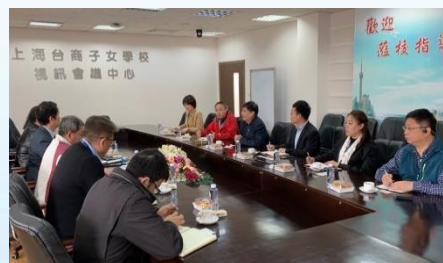
師資生參與校務會議