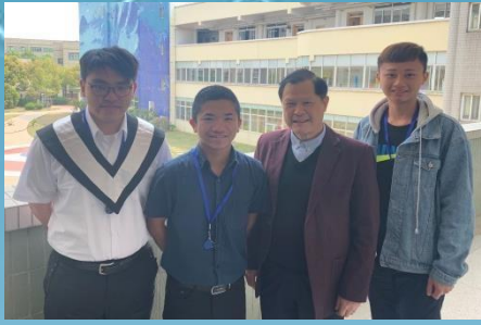
師資生與臺校國小部校長合影