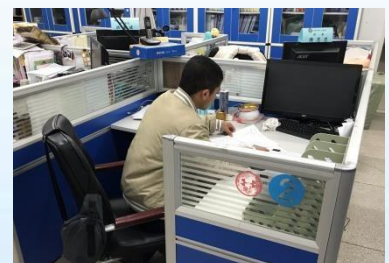
行政見習於教務處