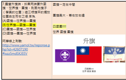
▲ 專業科目的題目及詳解