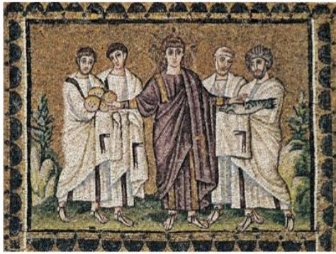
麵包和魚的奇蹟 〔The Miracle of the Loaves and Fishes〕約西元 504 年

新聖阿波里奈爾教堂〔S. Apollinare Nuovo〕，西羅馬帝國首都拉芬納〔Ravenna〕，義大利