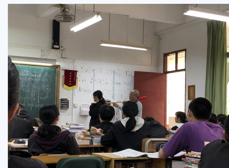
▲老師利用教室工具示範物理