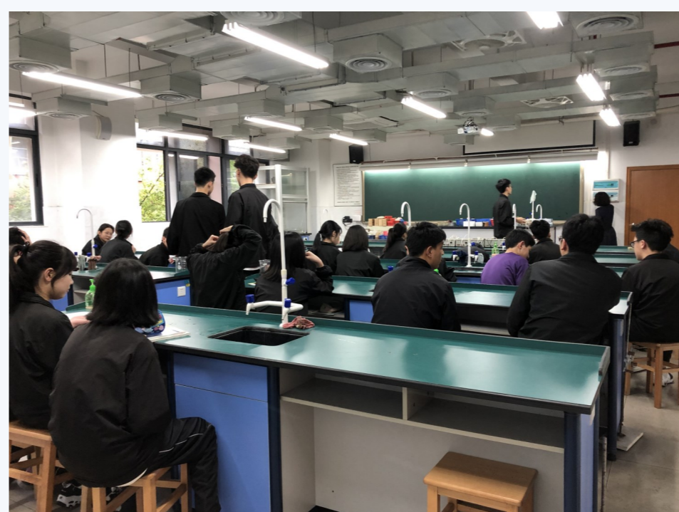
▲見習老師如何帶實驗課