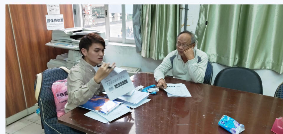
▲指導老師試教檢討