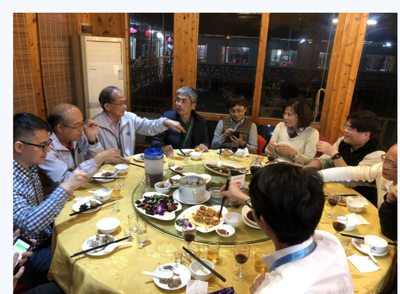
▲與校長董事老師聚餐