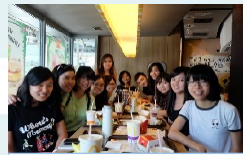
品嚐南洋風味美食