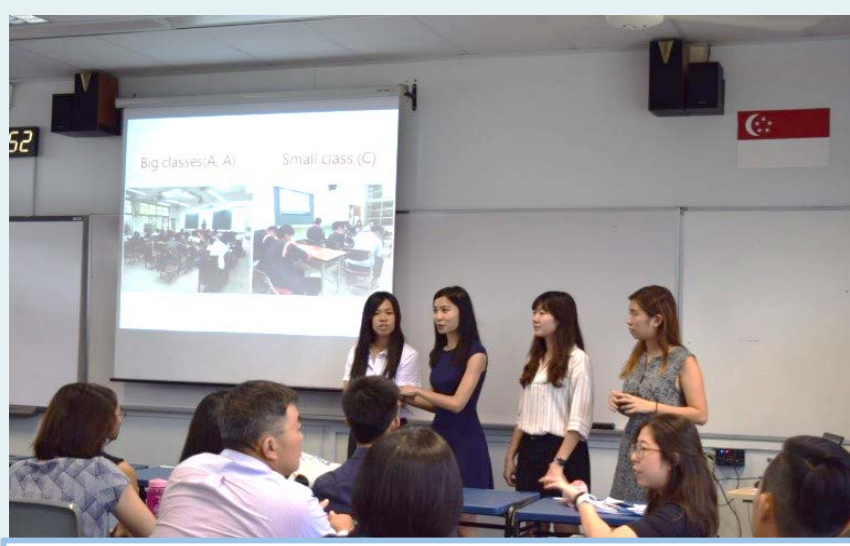
台新教育制度分享