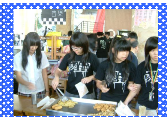
▲外籍學生參與班上園遊會活動